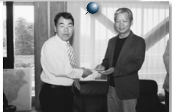
似顔絵会の収益金20万円を、倉吉市の「遙かなまち倉吉ふるさと基金」に寄付していただきました。