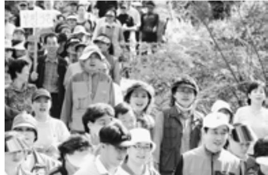
▲登山大会(2006年/開催地:韓国・仁川市)

あまり登山経験のない私も、大学生の時にサークルの合宿で1,500m級の山に登ったことがありますし、家