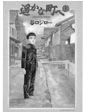
◎谷口ジロー『遙かな町へ』小学館