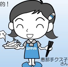
恵那手クス子さん

株式会社 エナテクス (信頼と技術と笑顔の会社) 倉吉市海田西町2丁目37 Tel:28-1111 E-mail:enatex@enatex.co.jp HP:http://www.enatex.co.jp/