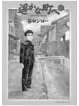
◎谷口ジロー『遙かな町へ』小学館