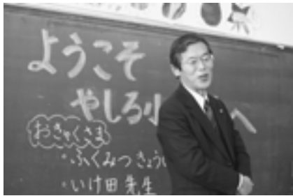
▲学校給食週間の会食会にて (1月28日・社小学校)