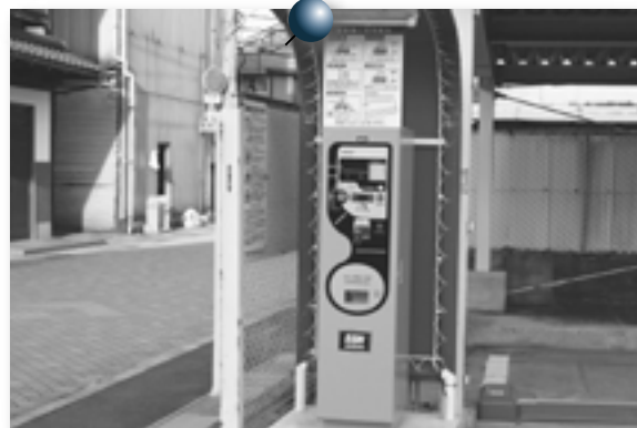
※出庫前に精算機で精算してください

市営新町駐車場が、自動料金精算システムを導入して、リニューアルオープンしました。普通車20台分の駐車スペース(フラップ式・1時間無料)が新設され、生活と観光が密着して共存する駐車場として期待されます。