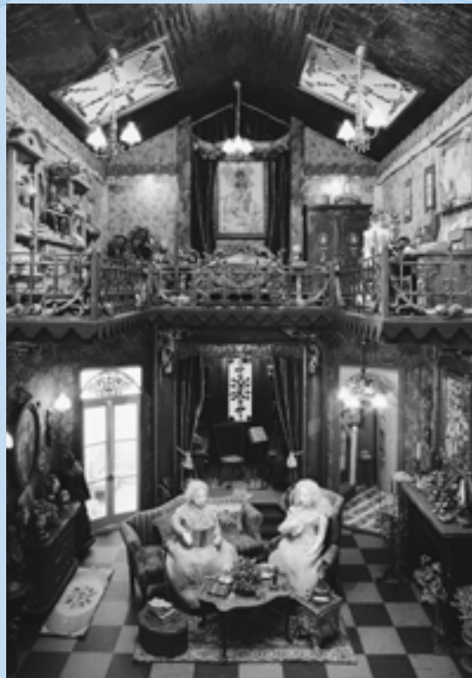
「Precious memory」 工藤 和代