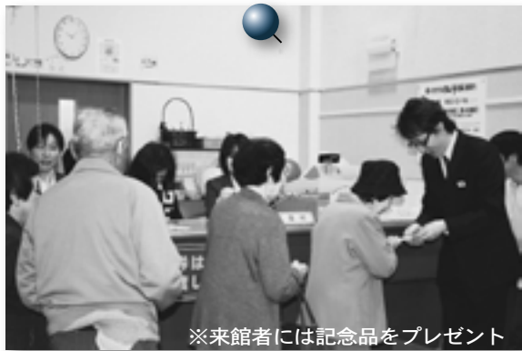
※来館者には記念品をプレゼント

有限会社トラベルシリウス(真庭市)が指定管理者となった湯命館で、リニューアルオープンセレモニーが行われました。食事処のリニューアルやキッズルームが新設されるなど、家族連れで来やすい施設になりました。