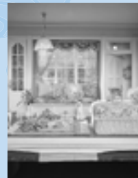
「女優A・Aのベッドルーム」 関 美代子