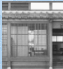
「宇野千代生家」 島木 英文