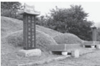
▲韓国の一般的なお墓