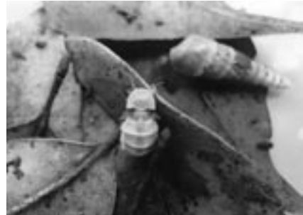
▲オオマドボタル(メス)

今回のウォッチングでは、その中でもオオマドボタルを観察します。短時間の観察会ですが、漆黒の中でのホタルの瞬きに目を凝らしてみませんか。