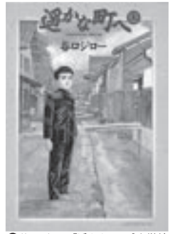
◎谷口ジロー『遙かな町へ』小学館