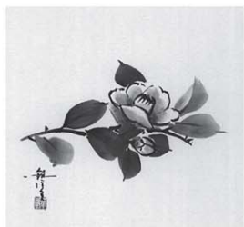
▲水墨画「椿」(和井観洋作)

水墨画は墨一色で描くため、濃淡や筆の運びでもものの形などを表現していきます。今回の講座では水墨画の技法や歴史を、初心者にもわかりやすく解説し、当日は色紙サイズの紙に花などを描きます。この機会に水墨画を始めてみませんか。