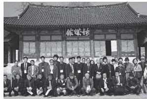
▲地方宮室 錦城館にて

また、農業関係者は、本市の鳥取二十世紀梨記念館のモデルとなった「羅州梨博物館」の視察や、羅州市内の農家視察、農業従事者との意見交換を行い、異国でありながら共通した点や参考となる技術を習得することで、より専門性の高い研修視察ができました。