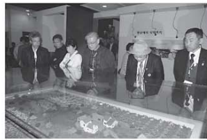
▲羅州市梨博物館を視察