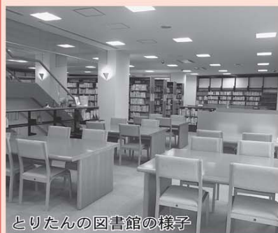
とりたんの図書館の様子

用証を発行します。短大の本を借りたいけど、直接来館で きない場合は、市立図書館を通して申し込みをすることもできます。その場合、市立図書館まで本をお届けします。本学図書館は、小説やエッセ