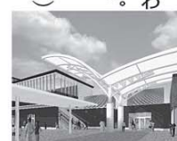
▲南口エントランスイメージ