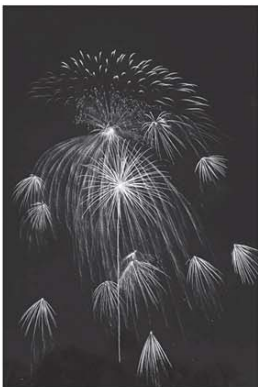
楽しいクラゲの親子