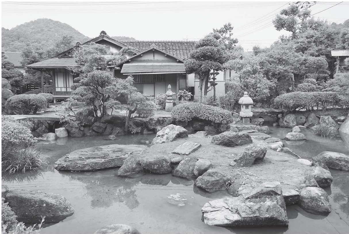
▲環翠園の中島と茶亭「南山荘」。倉吉にこんな見事な庭園があったのかと改めて驚きます。

5月21日(金)、国の文化審議会は、新たに2件の記念物の登録を文部科学大臣に答申しました。そのうちの1件として、河原町にある小川氏庭園が登録されました。登録記念物は、近代以降、地域の造園文化の発展に寄与してきた名勝地(庭園)のうち、幅広く継承していくため、保存や活用が特に必要なものとして、文化財保護法に基づき、文部科学大臣によって「文化財登録原簿」に登録される記念物です。