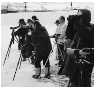
▲どんな鳥に出会えるでしょうか

冬の川沿いを通りかかると、川に浮かんでいるカモ類が目につきます。そのほかにも茂みの中には越冬のためやって来た渡り鳥、餌を求めて山から降りてきた鳥など、たくさんの鳥たちが集まってきています。