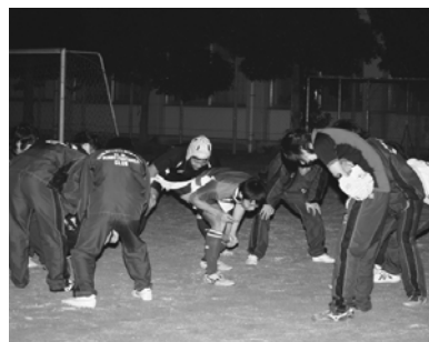
▲練習後に掛け声を出す部員たち

ビー部員は、先輩3人と僕だけでした。そのため、チームを作れず、練習なども他校と合同でしていました。それでも、翌年の春には7人の新入生が入部してきました。また、友人などを繰り返し勧誘して、その年の冬にはチームを作るのに必要な15人の部員が集まり、東高ラグビー部として試合をすることができました。 ラグビーは相手と体をぶつけ合う激しいスポーツです。初めは誰もが『痛い』とか『怖い』と思うものです。僕はキャプテンとしてそういった悩みや、さまざまな不満を持っている選手の話をしつかりと聞くことを心掛けています。時にはチームの中で話をして解決することもあります。部員たちには東高ラグビー部で仲間とプレーを続けてもらいた