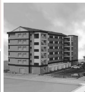
▲(仮)市営上灘中央住宅イメージ

2-8140 / keikan@city.kurayoshi.tokushima