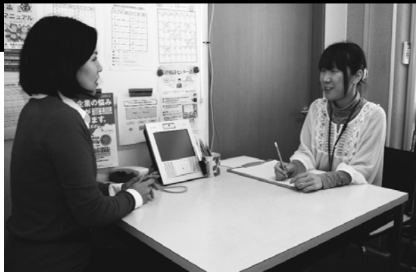
市民生活相談室での相談風景