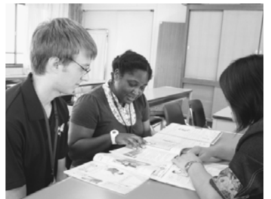
▲授業に向けて教材の内容を確認している様子

倉吉市では二人の外国語指導助手(A.L.T.: Assistant Language Teacher)を配置しています。A.L.Tは、市内の中学校を巡回し、日本人の英語教員とチームを作って授業を行ったり、小学校の外国語活動の支援を通して、児童・生徒との交流を深めています。8月に、政府が協力する「語