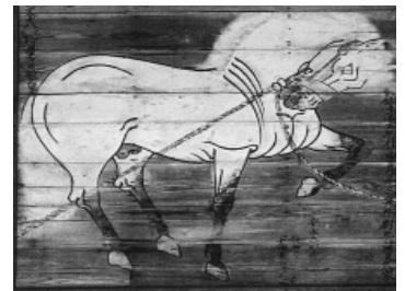
▲繫白馬図 天文18(1549)年 155.0cm×185.2cm