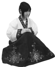
▲チマチヨゴリを着て、礼儀正しく座っている様子

このように、自国と違うマナーや習慣の背景にある理由を探求し、知ることが、異文化理解の醍醐味ではないかと思えます。