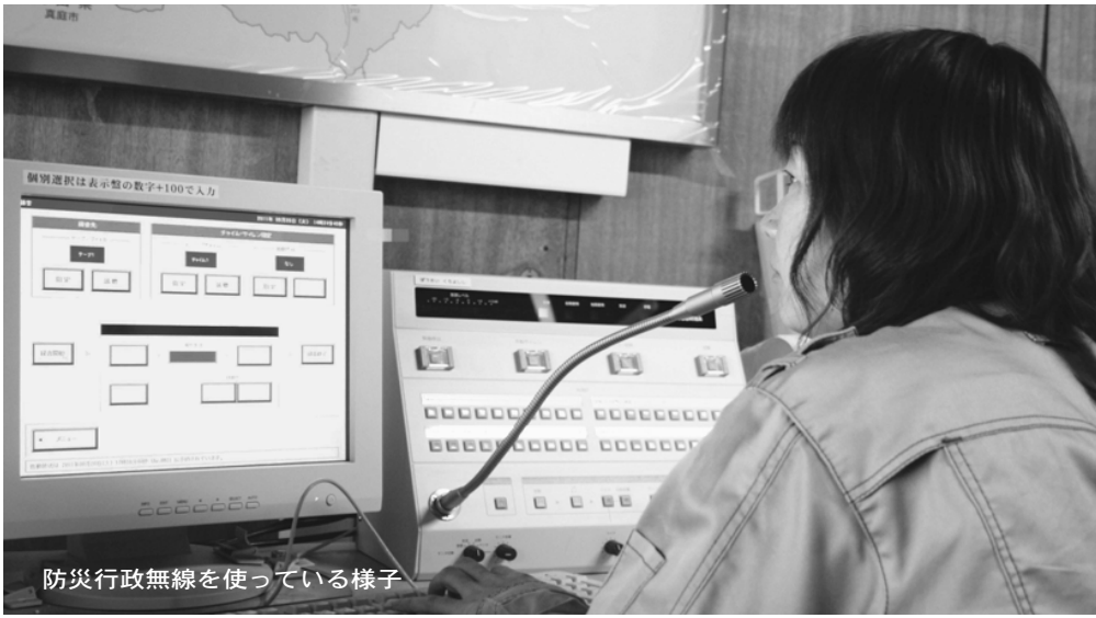
防災行政無線を使っている様子

★放送の内容 防災行政無線で放送できる内容は、電波法により、防災行政に関する内容だけに限定されていますが、地域振興波を利用することで、地域の情報伝達手段としても利用できます。