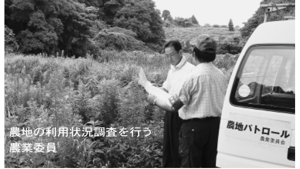
農地の利用状況調査を行う農業委員

任期満了に伴う農業委員の改選が行われ、新しい農業委員32人(選挙25人、鳥取中央農業協同組合推薦1人、鳥取県