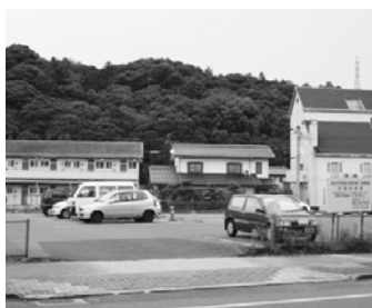
▲倉吉駅前第2駐車場(県道倉吉青谷線から北を向いて撮影)