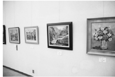
昨年の創作文華展(ちぎり絵)