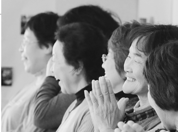
笑顔が絶えない「きらら会」参加者(11月19日(月))

きらら会では、地域住民だけが集まるだけでなく、スタッフの交友関係を活かし、地区外からもボランティアに参加して