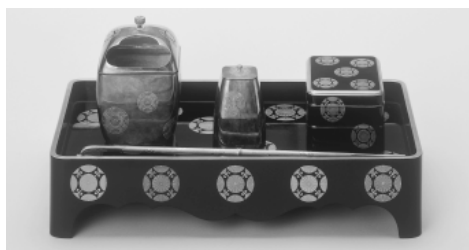
▲菊浮線綾文蒔絵煙草盆 (閑院宮家紋章入 大聖寺蔵)