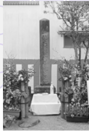
▲大江磐代君 生誕の碑 (倉吉市湊町)

「りん」の家柄・身分など詳し いことはわかっていません。一 説には、田町で焼き餅を売って