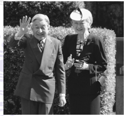
▲倉吉博物館を視察された、 天皇、皇后両陛下 (平成23年10月31日(月))