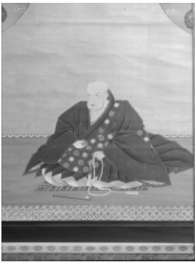
盈仁法親王像(聖護院蔵)