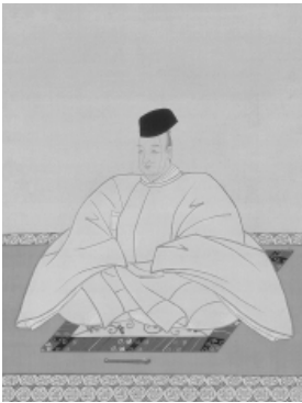
光格天皇像(泉涌寺蔵)