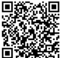
市公式フェイスブック用 QRコード