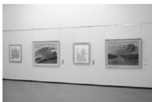
▲昨年の展示風景(日本画)

倉吉市をはじめ、中部地区の美術活動の発展と発表の場である倉吉市美術展覧会は、今年で58回を迎えます。今年も高校生をはじめ、幅広い年代から出品を募り、洋画・日本画・版画・写真・彫刻・工芸・書道・デザインの8部門にわたる多彩な作品を、前・後期に分けて展示します。