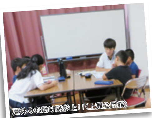
夏休みお助け隊参上!!(上灘公民館)

将来は世界で活躍したいという夢があり、倉吉を離れることは仕方ないと割り切っていますが、退職後に倉吉に戻り、小学生に自分が受けたような体験をさせてあげられる大人になりたいと思います。