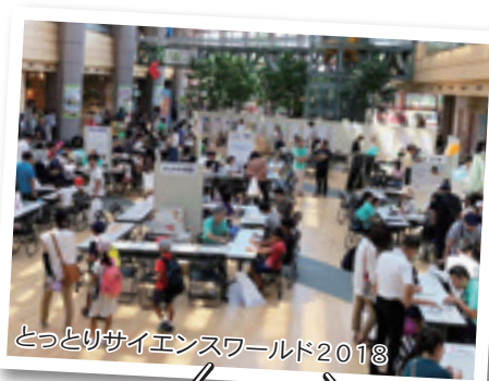
とっとりサイエンスワールド2018

ボランティア活動は友達に誘われて参加しました。実際に参加したら面白く、誘ってくれた友だちに感謝しています。いろいろな人とコミ