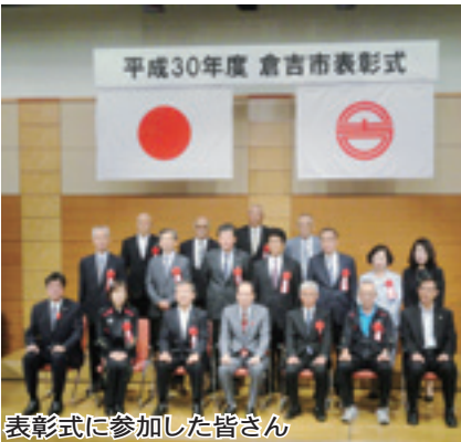
表彰式に参加した皆さん