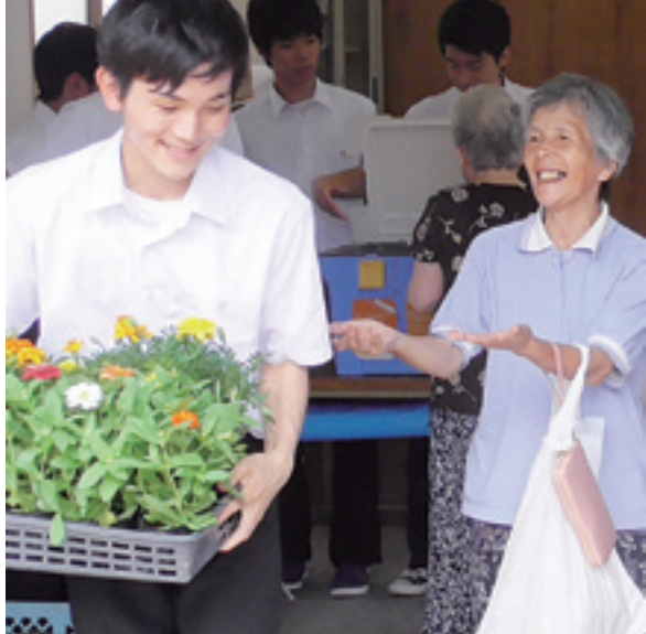
(左)倉吉農業高等学校 北谷地区販売 (中)倉吉総合産業高等学校「くらそうや」 (右)倉吉北高等学校「倉北カフェ」