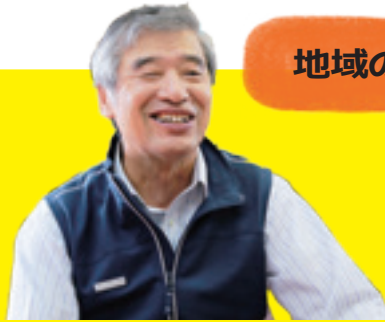
倉吉市公民館連絡協議会会長 (灘手公民館館長)