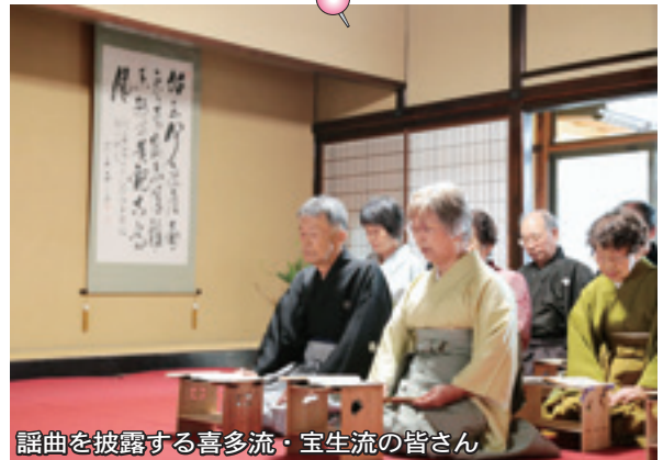
謡曲を披露する喜多流・宝生流の皆さん

倉吉淀屋開館10周年を記念した文化事業の一つとして、「謡曲・仕舞を楽しむ会」が行われました。開館から10年間のあゆみを紹介したのち、喜多流・宝生流の皆さんが能楽作品の「高砂」と「羽衣」を演じました。「羽衣」では、広々とした奥座敷に響く天女伝説の謡いに合わせ、舞が披露されました。最後に、おめでたいことを謡い継ごうとの思いから、喜多流・宝生流の皆さんと参加者が一緒に「高砂」を謡い、イベントをしめくくりました。