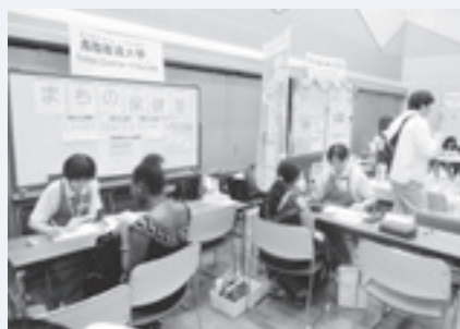
「グローバルまちの保健室」の様子

11月25日(日)には伯耆あわせの郷で行われる「くらし国際交流フェスティバル」にも出展しようと準備中です。市民の皆さま、ぜひお越しください。