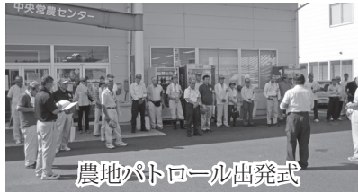
農地パトロール出発式

農業委員会では毎年1回(平成24年8月)、農地が適正かつ効率的な耕作がされているか、農地パトロールによる利用状況調査を実施しています。