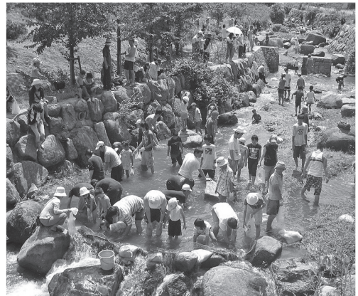
浅井集落親水公園魚のつかみ取り交流風景