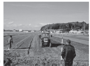
麦播種・大豆防除スナップ