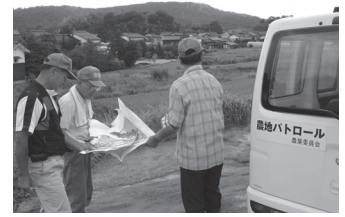
農地パトロール風景