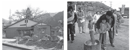
農産物加工センター・もちつき交流イベント風景