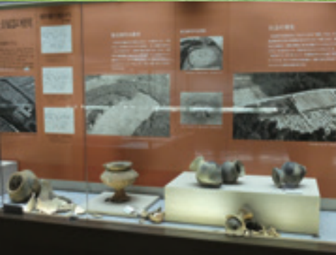
▲鳥取県中部地震直後の展示物