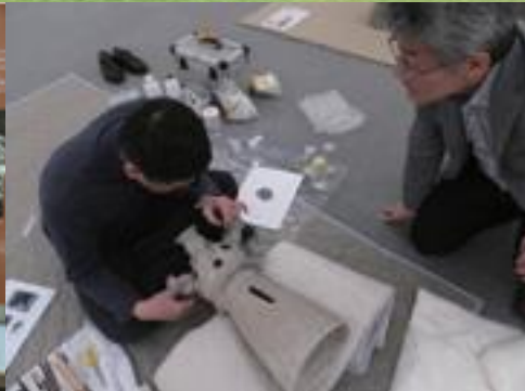
▲被災した所蔵品の修復作業