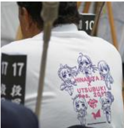
▲今年の打吹まつりを盛り上げようと、議員も議場で、まつりをPRするポロシャツを着用。

水害時の避難行動の要支援者、高齢者、障がい者の避難に関しては、地域防災計画の中で避難行動要支援者一人一人の状態を踏まえた避難支援策定作業を進めている。プラン、個別の支援計画を策定することになっている。地域の支援者、要支援者本人とも相談しながら、計画の策定作業を進めている。