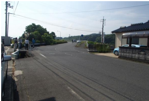
倉吉市上福田付近