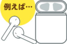
ワイヤレスイヤホン