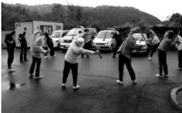
<ウォーキング教室参加者の様子>