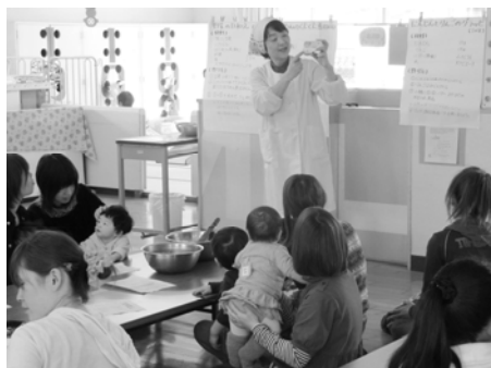
<子育て支援センターでの離乳食づくり>