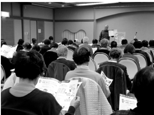
<ホッといきいき教室の参加者の様子>