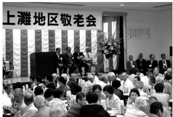
<敬老会参加者の様子（上灘地区）>