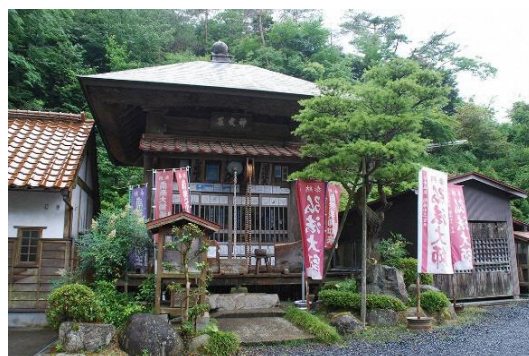
関金の温泉街にある「地藏院」

至っている。温泉地として区域が広がりはしたものの、閑静で落ち着いた雰囲気を保っている。なお、前述の国鉄倉吉線は、昭和33年（1958年）に山守まで延伸され、さらに中国山地を越えて姫新線の中国勝山駅まで延伸する計画もあったが、昭和60年（1985年）に全線廃止となっている。