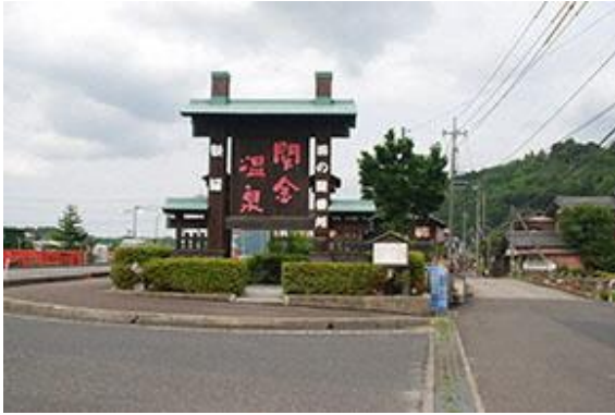
美作街道の番所（関所）跡

関金温泉では、行基の開湯伝説にちなんで平成29年（2017年）を開湯1300年とすることになり、「源泉回帰」をスローガンに「関金温泉開湯1300年祭」を企画した。関金温泉を中心として、歴史・地域文化・健康等をテーマとする地域資源を活用した種々の催しを実施し、新たな100年に向けてスタートを切っている。