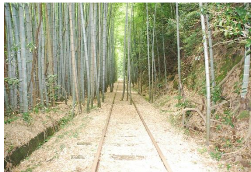
竹林に囲まれた国鉄倉吉線の廃線跡