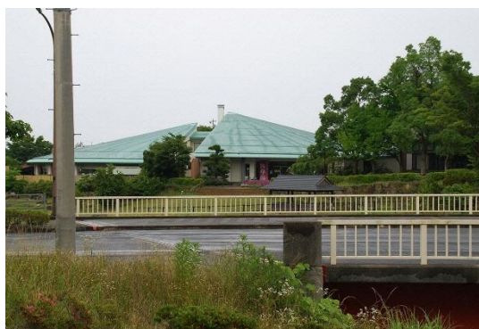
湯中運動が実施される「湯命館」