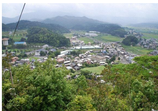
亀井公園から望む関金の温泉街