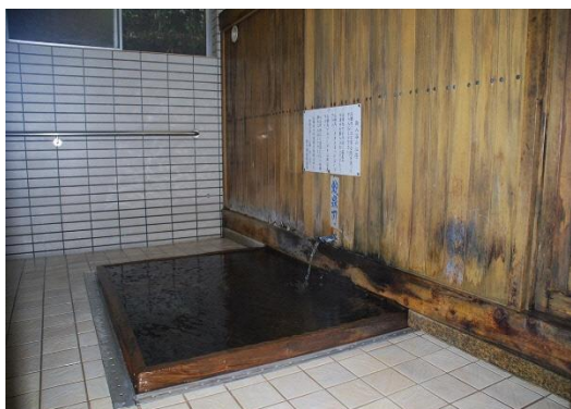
共同浴場「関の湯」の浴槽