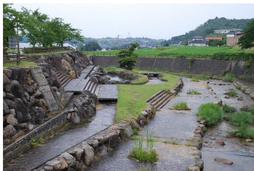
滝川に整備された「滝川親水公園」